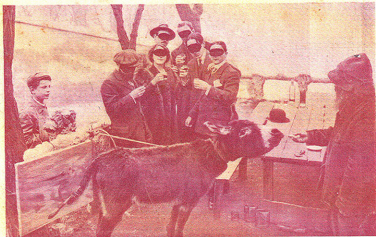
Comment fut confectionné le chef-d'œuvre "Et le soleil s'enormit sur l'Adriatique".